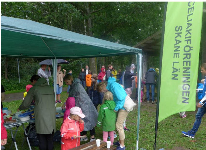
SCF Skåne och SCUF region Syd:s familjedag på Tosselilla i juli.